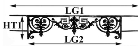
Schéma explicatif dimensionnel